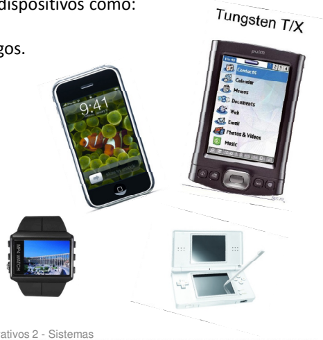
Sistemas Operativos 2 - Sistemas empotrados

Sus características permiten que los ingenieros puedan diseñarlos de la manera más óptima para realizar la tarea para la que son creados.